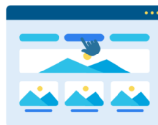
After the large element is loaded , the browser starts processing the interaction with the sidebar